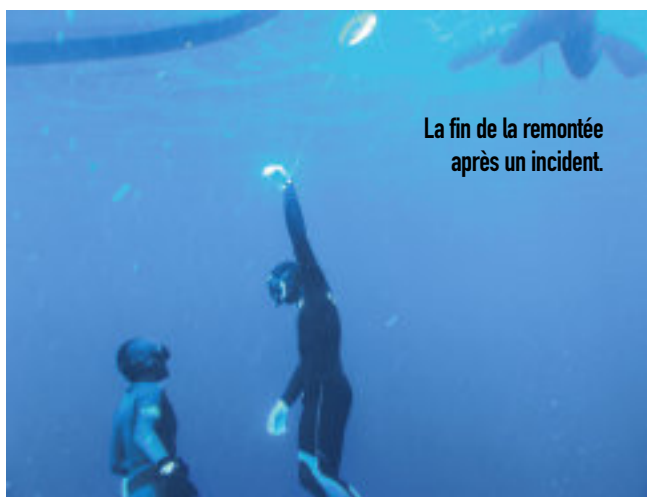
La fin de la remontée après un incident.