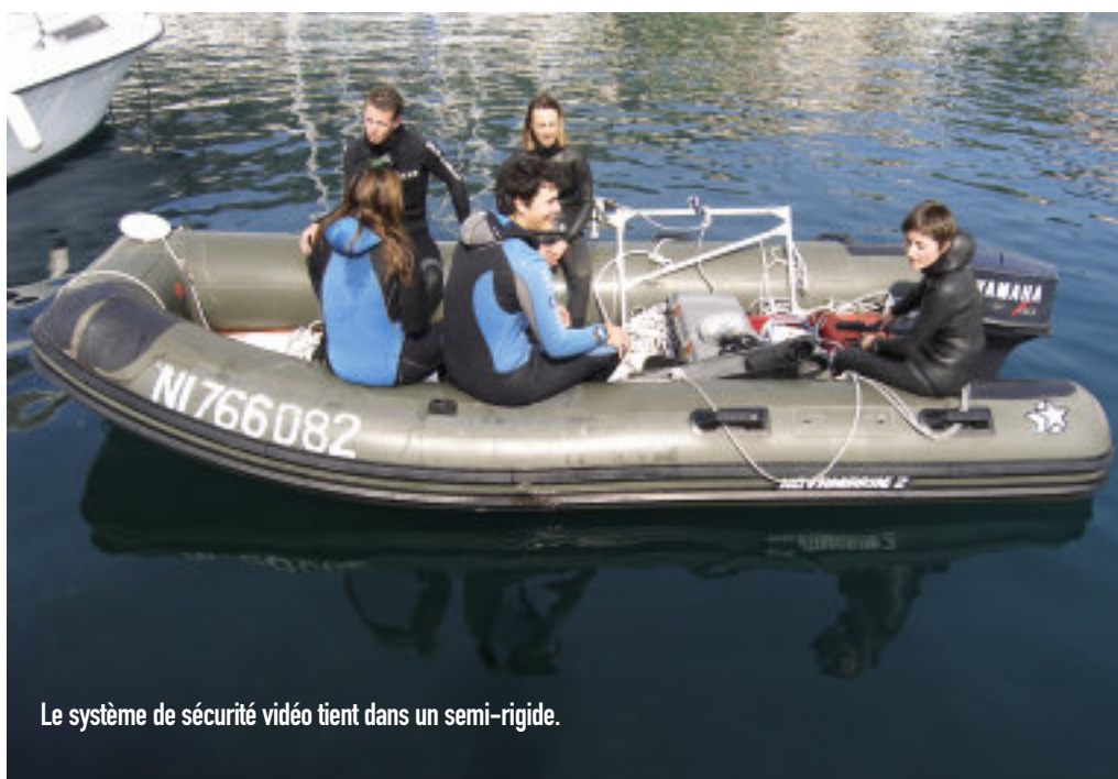
Le système de sécurité vidéo tient dans un semi-rigide.

Dans le premier cas, s'il s'agit d'un apnéiste "connu" et dont les temps de plongée sont bien estimés (d'où l'importance des repères chronométriques à l'entraînement), le contrepoids est déclenché s'il n'est pas en vue de la surface une dizaine de secondes avant la fin de son apnée. Prenons l'exemple de Natalia Molchanova, lorsqu'elle a battu le record du monde féminin le 3 septembre 2005. Elle avait annoncé 86 m en poids constant et un temps estimé de 3 mn 10 s. L'apnéiste devait donc être en vue de la surface aux environs de 3 mn. Justement, ce jour-là, Natalia a été plus lente et les apnéistes de surface, excepté celui qui était sous l'eau pour assister ses derniers vingt mètres, ne l'avaient pas en vue au bout de 3 mn. Nous avons donc déclenché le contrepoids et immédiatement arrêté quand Natalia est arrivée en vue de la surface aux environs de 3 mn 15 s.